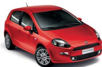
176 ROSSO PASSIONE* (extraserie)