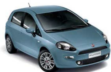
401 BLU SERENATA* (extraserie)