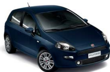
475 BLU RIVIERA