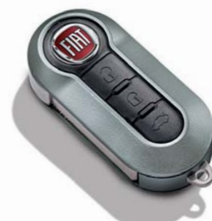
Grigio Titanio Opaco