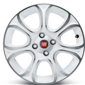
50902779 Cerchi in lega da 16" bianchi diamantati (Lineaccessori)