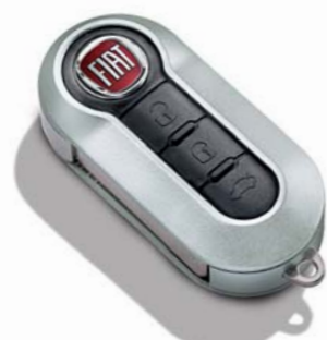
Grigio Argento Opaco