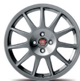
50902243 Cerchi in lega da 17" bruniti (Lineaccessori)