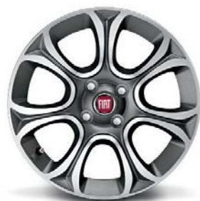
50902778 Cerchi in lega da 16" bruniti diamantati (Lineaccessori)