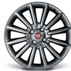
5A6 Cerchi in lega da 17" bruniti 205/45 R17 (non catenabili)