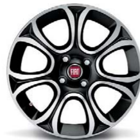
5FB Cerchi in lega da 16" diamantati nero lucido 195/55 R16 (non catenabili)