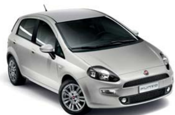
348 GRIGIO ARGENTO*