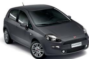
679 GRIGIO MODA*