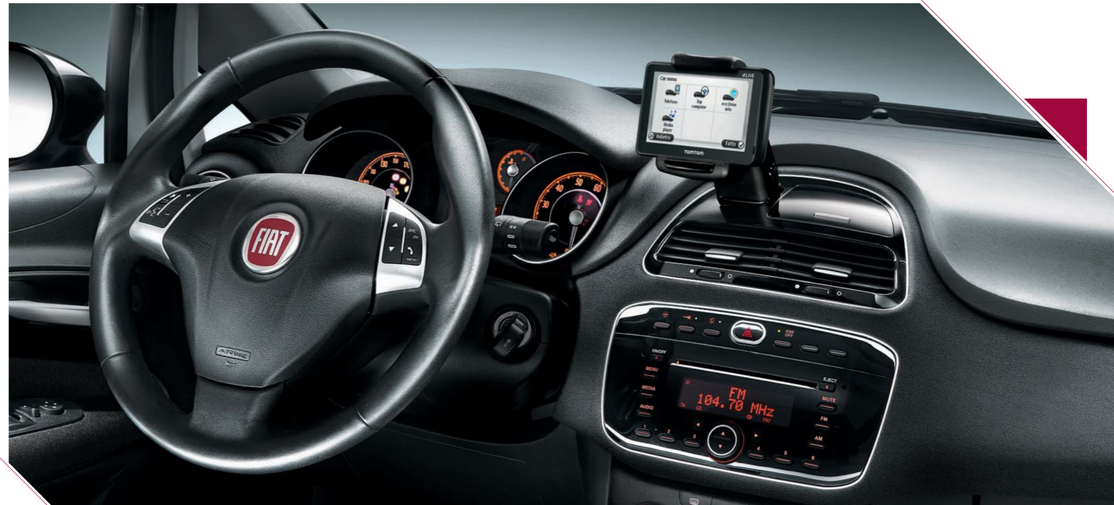
Sistema Blue&Me TomTom