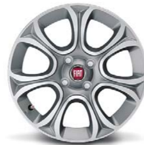
439 Cerchi in lega da 16" diamantati 195/55 R16 (non catenabili)