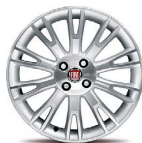
50901339 Cerchi in lega da 17" (Lineaccessori)