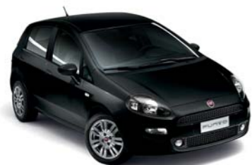
876 NERO TENORE*

* I colori esterni nella configurazione SPORT LOOK prevedono il tetto nero.