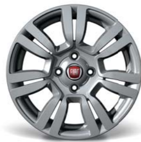
108 Cerchi in lega da 15" 185/65 R15