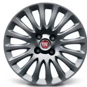
878 Copricerchi bruniti 175-185/65 R15