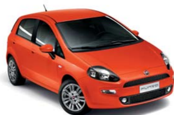
562 ARANCIO SICILIA* (extraserie)