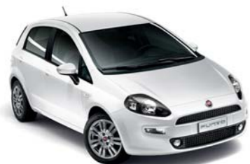
296 BIANCO GELATO*