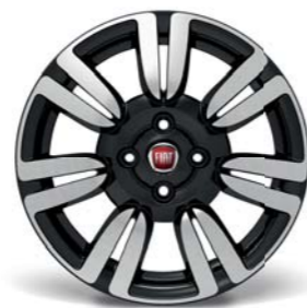
421 Cerchi in lega da 15" diamantati nero lucido 185/65 R15